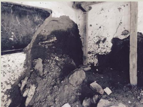
La salle de classe après le séisme : deux murs arrachés, le toit étayé par plusieurs poutres, 4 salles de classes inutilisables,...