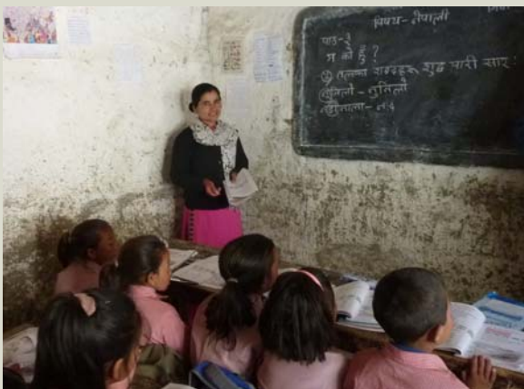
Une salle de classe avant le séisme